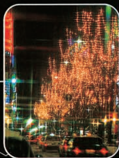
▲ イルミネーションストリート

◎協賛行事 ミュンヘン・クリスマス市 in Sapporo 2003年11月28日～12月21日