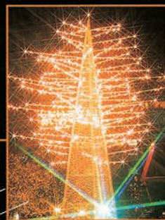
▲ [2丁目] 宇宙の領域