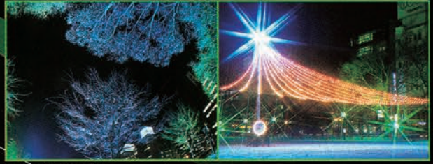
▲ [6～8丁目] 光の森

◎点灯期間 [大通会場] 2003年11月21日～2004年1月4日 [駅前通会場] 2003年11月21日～2004年2月11日 ※第55回さっぽろ雪まつり(2004年2月5日～11日) 終了まで ◎点灯時間 16:00～22:00 (12月23日、24日、25日・31日は24:00まで)