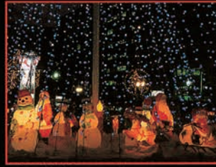
▲ [3丁目] クリスマスツリー