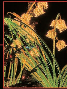
▲ [3丁目] スズラン