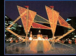
▲ [5丁目] 光る帆船