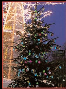
▲ [3丁目] 協賛行事: ソーラーツリー 市民クラブによる太陽光発電