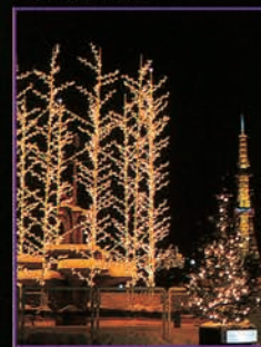
▼ [4丁目] 針葉樹