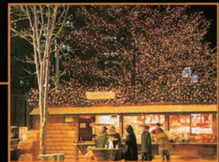
▲ [2丁目] 協賛行事: ミュンヘン・クリスマス市 in Sapporo

◎協賛行事 ミュンヘン・クリスマス市 in Sapporo 2003年11月28日～12月21日