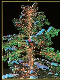
▲ [1丁目] 協賛行事: 愛のツリー