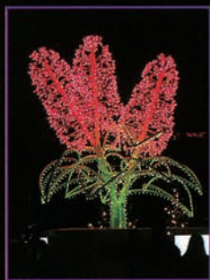
▲ [4丁目] ライラック