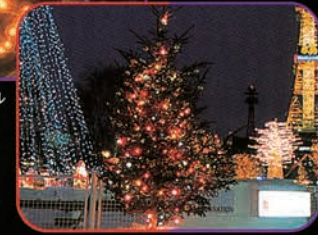
▲ [3・4丁目] デコレーションツリー