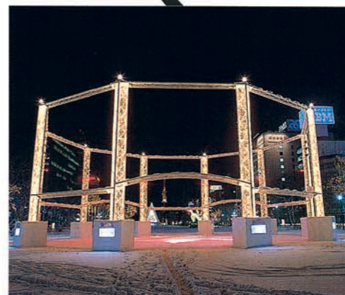
8丁目 光のサークル