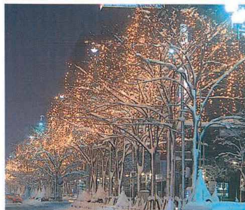
駅前通り イルミネーションストリート