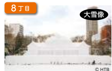
旧札幌停車場 Old Sapporo Station