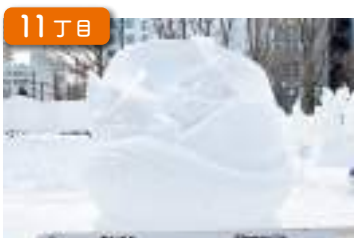
国際雪像コンクール International Snow Sculpture Contest