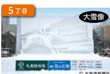
栄光を目指し駆けるサラブレッド A Thoroughbred Galloping towards Glory