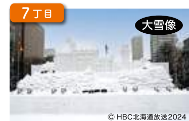
ノイシュバンシュタイン城 Neuschwanstein Castle