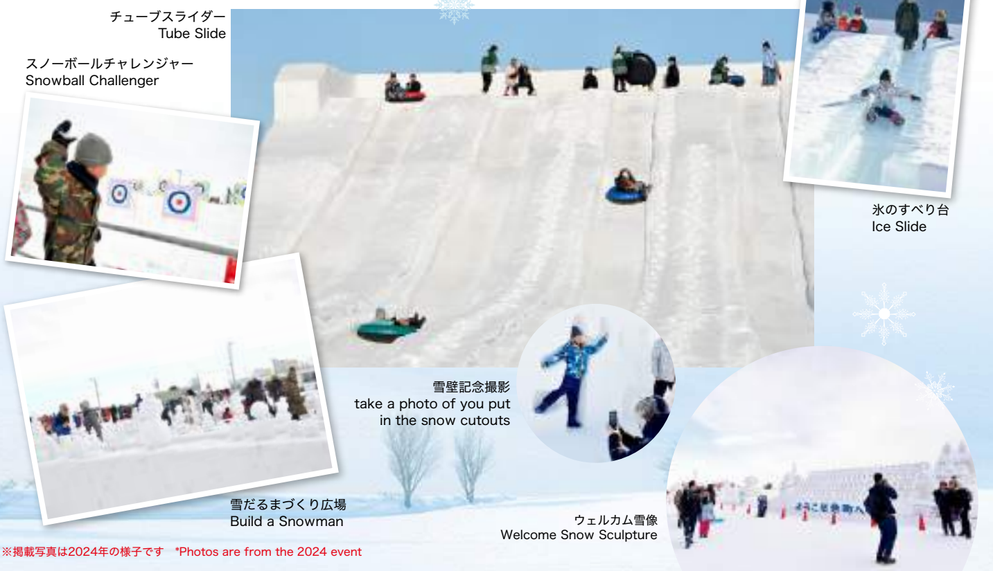
チューブスライダー Tube Slide スノーボールチャレンジャー Snowball Challenger

Tsudome Site is a popular destination where parents and children can enjoy slides and snow rafts, and more. The indoor space features the Gourmet Food Court, a resting area, and attractions for children. Come play in the snow and enjoy the unique Hokkaido experience.