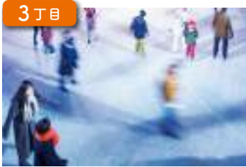
スケートリンク Ice rink