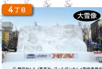
ウポポイ(民族共生象徴空間)×『ゴールデンカムイ』 Upopoy National Ainu Museum and Park × 『GOLDEN KAMUY』