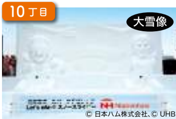
北海道ボールパークFビレッジ Let's play! スノースライダー 『HOKKAIDO BALLPARK F VILLAGE Let's play! Snow Slider』