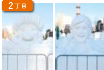
市民雪像 Citizen's Snow Sculptures