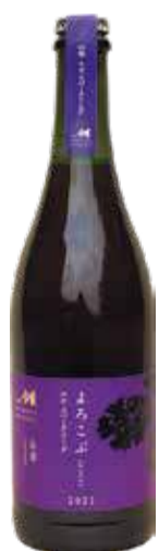
よろこぶ山幸 ロゼスパークリング

【生産者】めむろワイナリー 【産地】芽室町 【タイプ】山幸 【味わい】泡・ロゼ/辛口 【説明】小さな赤い果実の甘酸っぱい香り、キリッとした酸味のアタック、山幸らしい果実味は若くフレッシュな仕上り。