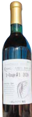
カノンズ K-rouge #1 豊平峡ダム熟成ワイン

【生産者】八剣山ワイナリー 【産地】札幌市 【タイプ】数種類の黒ぶどう 【味わい】赤/ミディアム 【説明】定山溪にある豊平峡ダム、その工事中トンネルの中で3年間ひっそりと眠り続けたワイン。カベルネ系ぶどうを数種類使用。