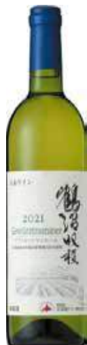
北海道ワイン 鶴沼 ゲヴェルトトラミネール

【生産者】北海道ワイン 【産地】小樽市 【タイプ】ゲヴェルトトラミネール 【味わい】白/やや辛口 【説明】ライチや白桃、柑橘のような香りがあり、冷涼な北海道の気候を反映した爽やかな酸が特徴の白ワイン。