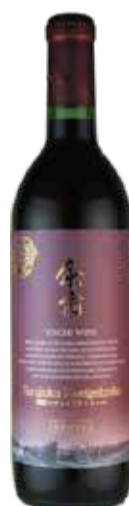
樽熟ツヴァイゲルトレーベ

【生産者】余市ワイン 【産地】余市町 【タイプ】ツヴァイゲルトレーベ 【味わい】赤/フルボディ 【説明】余市ワイナリー往年のベストセラー。長期間の樽熟成により果実味と酸味、渋みが見事に調和します。