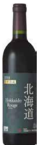
北海道木樽熟成ルージュ

【生産者】北海道ワイン 【産地】小樽市 【タイプ】数種類の黒ぶどう 【味わい】赤/ミディアム 【説明】山葡萄系品種をはじめ、複数の黒葡萄品種を8か月間にわたり木樽で熟成。深い色合いに見合う滑らかなコク。