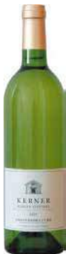
北ワイン ケルナー

【生産者】千歳ワイナリー 【産地】余市町 【タイプ】ケルナー 【味わい】白/やや辛口 【説明】青リンゴや洋ナシのような華やかなアロマ、北海道らしい爽やかな味わいが特徴です。フレッシュなやや辛口。