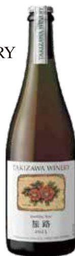
旅路 ロゼスパークリング

TAKIZAWA WINERY Produced by Nobuo Takizawa